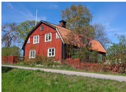
... liksom Nedergården..