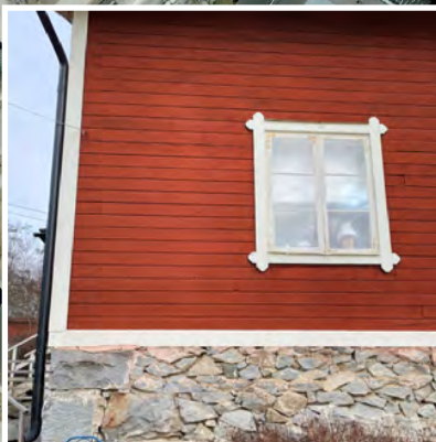
Inspiration från Stenbrottet och Stenhuggarbyn efterfrågas för nya byggnader.

Ett centralt beläget torg, stenhuggarkonst och nybyggnation som bevarar lantlighet var några av önskemålen. Var torget ska placeras råder det delade meningar om.