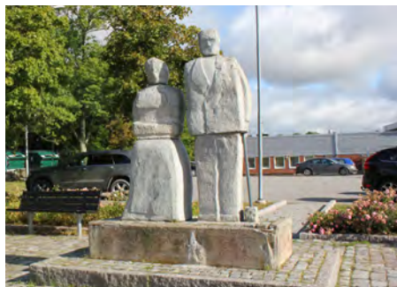
Många vill bevara "Gumman och gubben"...

Platser att mötas på är ett genomgående tema även när det kommer till förslag på utemiljö och grönområden. Platser för identitetsskapande aktiviteter och platser för spontana möten efterfrågas liksom platser där man kan sitta, grilla, leka och idrotta.